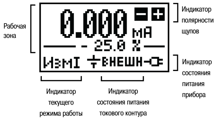
Рисунок 3 – Экран прибора

На экране прибора имеется рабочая зона, содержимое которой меняется в зависимости от текущего режима работы, и постоянно присутствующие во всех режимах работы индикаторы: