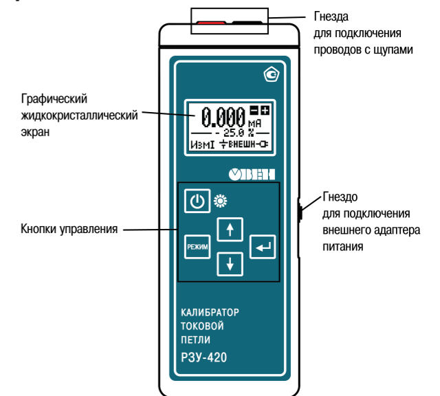
Рисунок 2 – Внешний вид прибора

На лицевой поверхности прибора имеется графический жидкокристаллический экран и 5 кнопок управления.